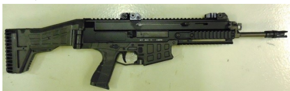
PU 5,56MM BREN2 HL. 11"